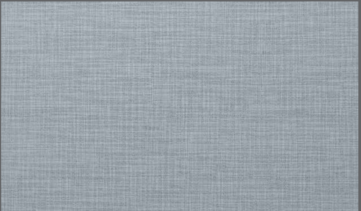
Summer Weave | 9908 LRV 36

LRV = light reflectance value LRV = Lichtreflexionsgrad LRV = Valor de reflectancia de la Luz LRV = IRL : Indice de Réflexion Lumineuse