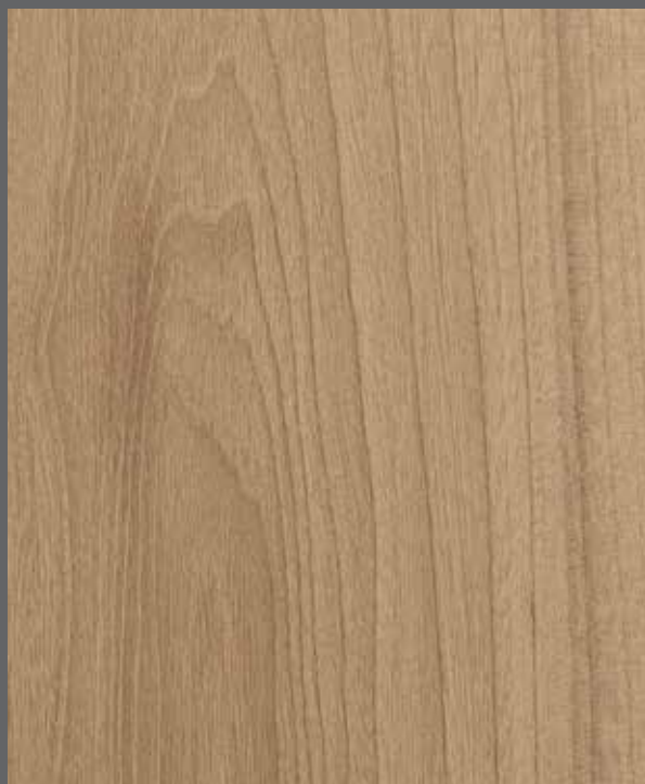
Warm Woodgrain | 9904 LRV 38