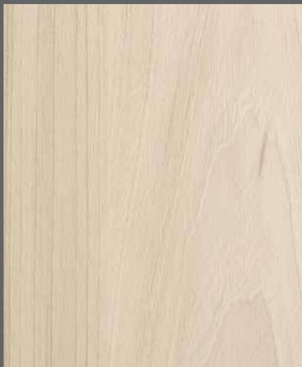
Soft Woodgrain | 9901 LRV 52