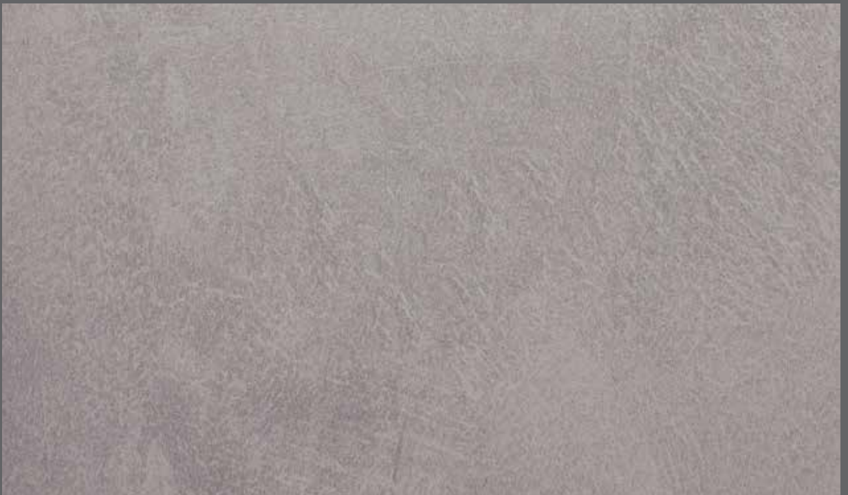
Urban Mineral | 9907 LRV 28

Exact material match with samples cannot be guaranteed. Eine exakte Übereinstimmung des Materials mit Mustern kann nicht garantiert werden. Las muestras no pueden garantizar un color exacto. Les échantillons ne peuvent garantir le coloris exact.