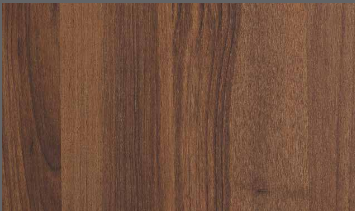
Rich Woodgrain | 9902 LRV 14