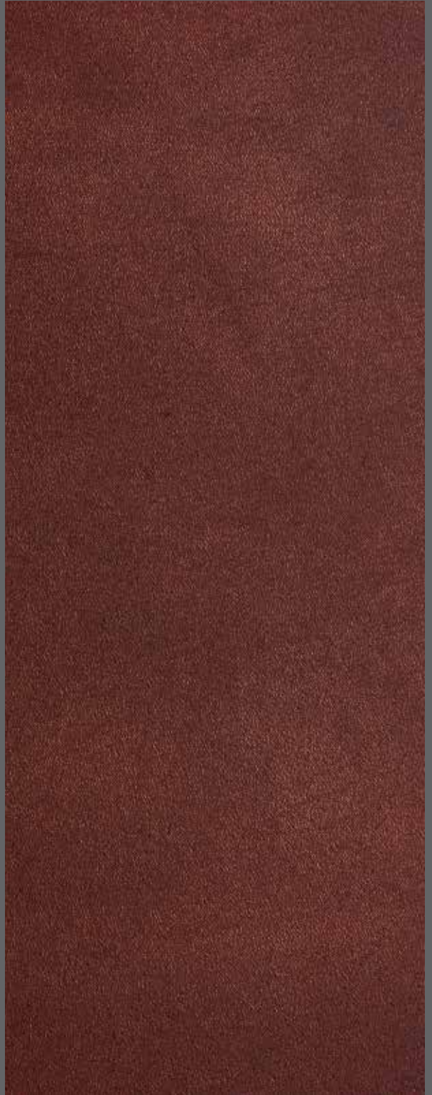
Antique Copper | 9912 LRV 9

Coordinating and contrasting trims available. Farblich passende und kontrastierende Profile verfügbar. Molduras en tonos que contrastan o combinan. Profils de coordination et de contraste disponibles.