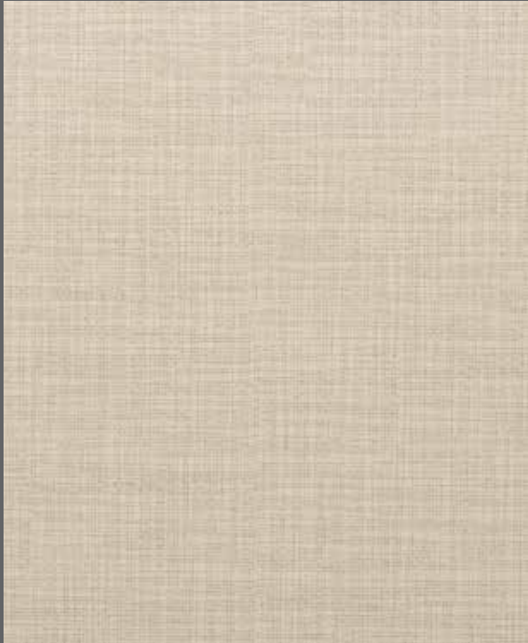
Winter Weave | 9909 LRV 58