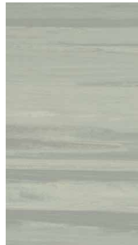
NA 10 Nimbus