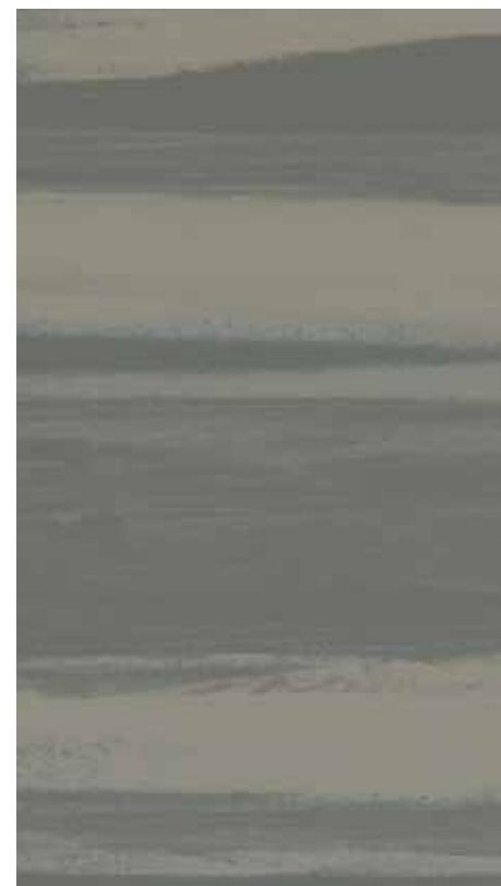
NA 09 Cliff