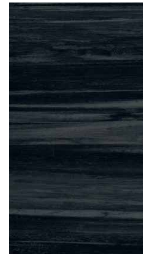
NA 12 Charcoal