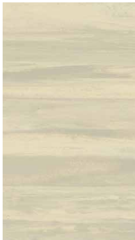
NA 07 Ecreu