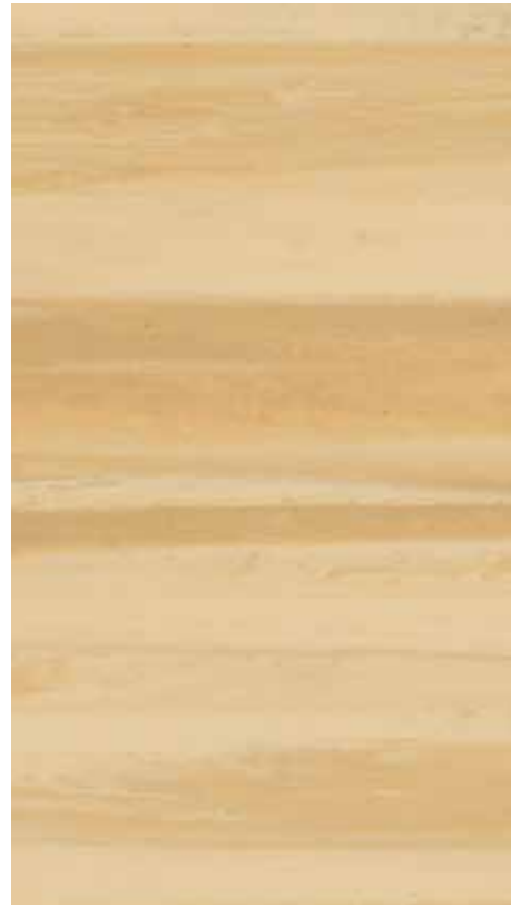
NA 02 Hay