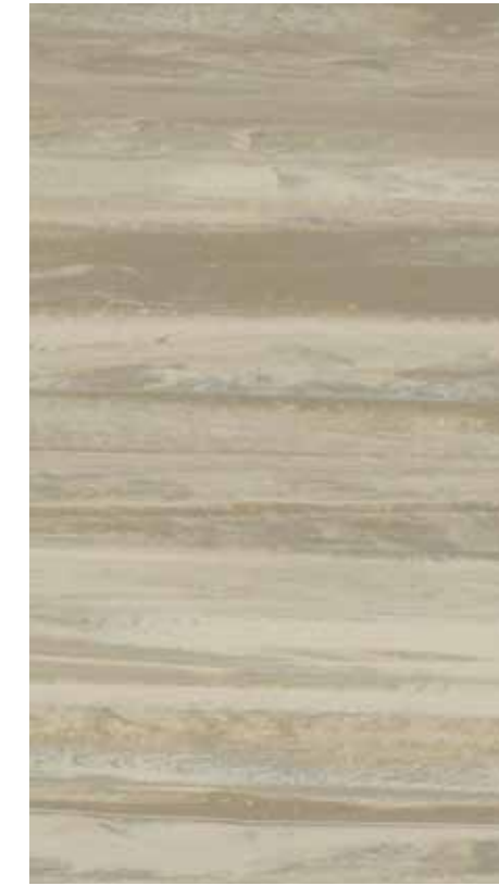
NA 08 Desert