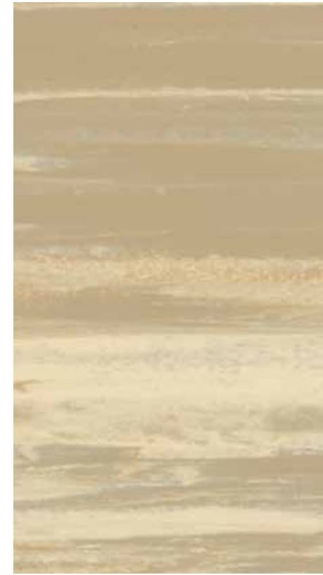
NA 04 Sand