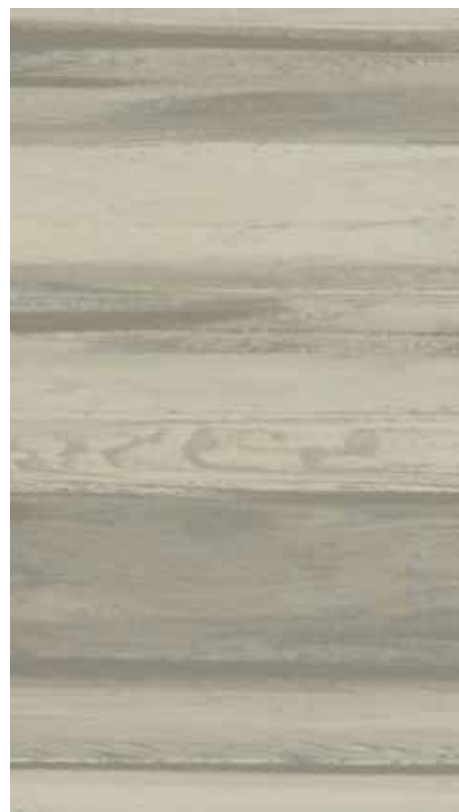
NA 05 Greige