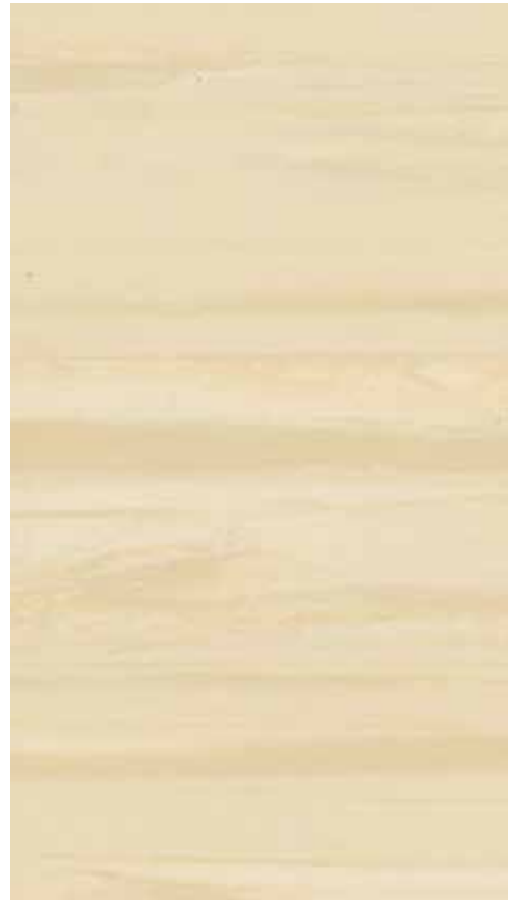
NA 01 Cream

Classification UPEC U 1 P 1 E 2 C 1 * Classified C 1 if greasy substances are used