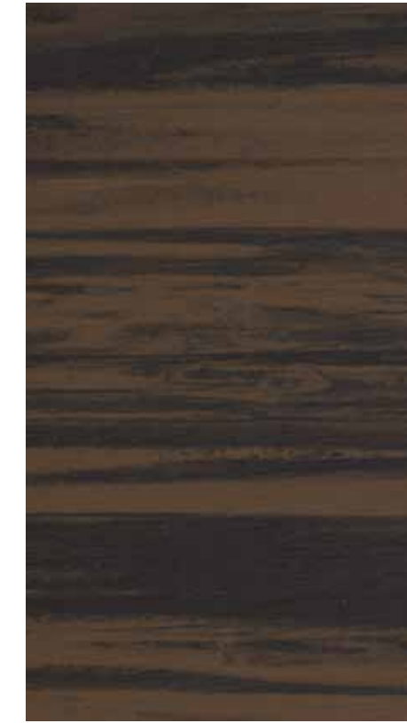
NA 06 Walnut