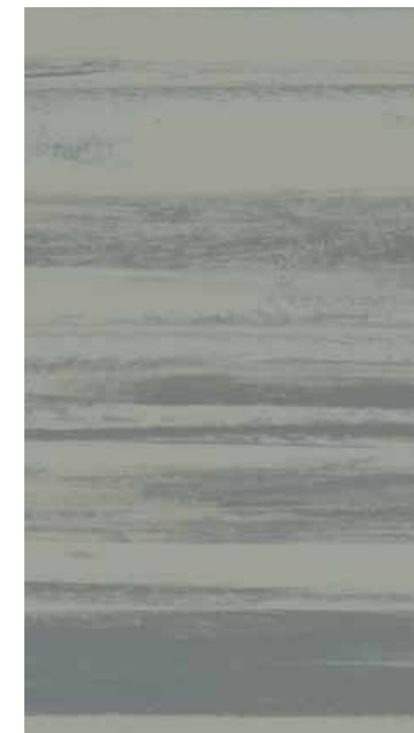
NA 11 Metal