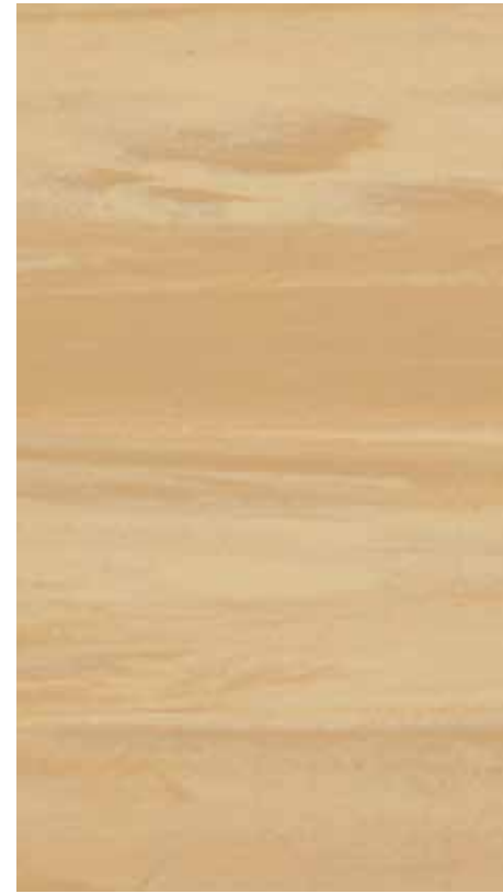
NA 03 Summer