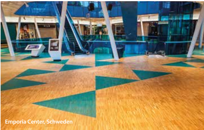
Emporia Center, Schweden