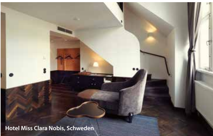
Hotel Miss Clara Nobis, Schweden