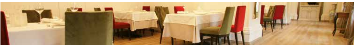
Restaurant Dom, Moskau - Russland