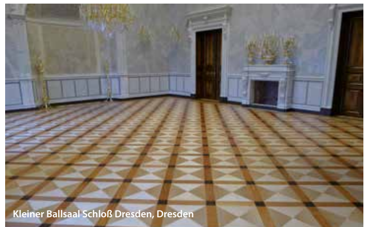
Kleiner Ballsaal Schloß Dresden, Dresden